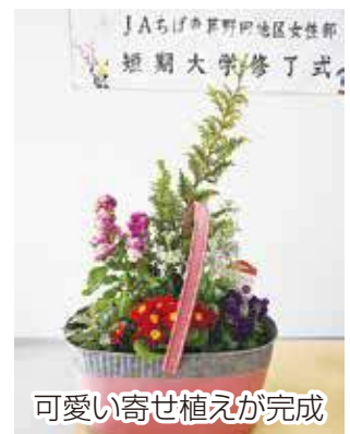
可愛い寄せ植えが完成

また、今年度最後となった今回の講座の後、短期大学の修了式を行い、全6回全て参加した11名に皆勤賞が贈られました。