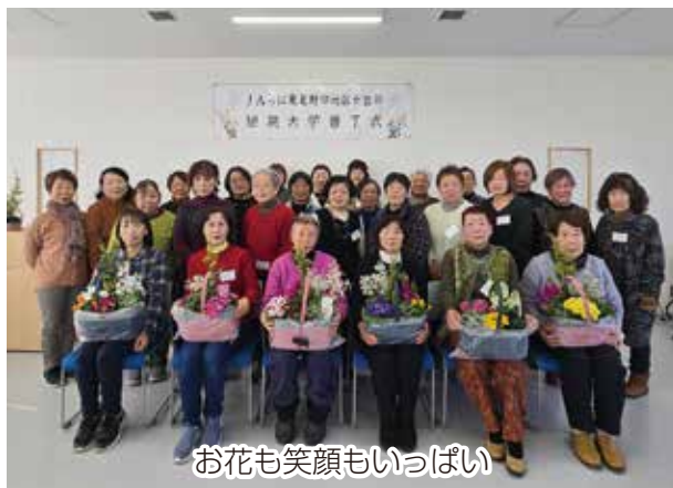
お花も笑顔もいっぱい

JAちば東葛野田地区女性部は2月9日、野田地区多目的ホールで女性短期大学第6回講座を開催し、26名が参加しました。