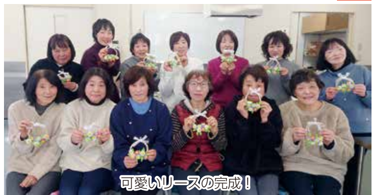
可愛いリースの完成!

今年度最後となる今回は、家の光に掲載された「モールで作るデイジーのリース」作りに挑戦。針金が入ったモールを丸く巻いて花びらや花柱を作り、デイジーの花が可愛らしく咲く様子を表現しました。同じ材料を使用した作品作りでしたが、モールの巻き方もそれぞれで、「綺麗に丸まらない」や「どうやって巻くの?」など会話をしながら、個性が光る素敵なリースを完成させました。