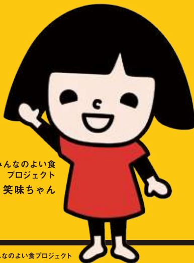
みんなのよい食 プロジェクト 笑味ちゃん