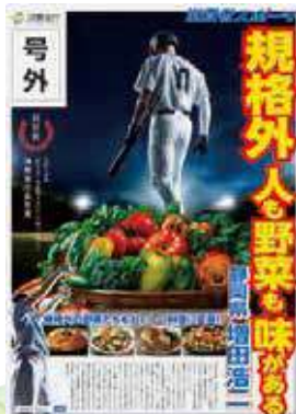
～令和6年度「めざせ!食品ロス・ゼロ」川柳コンテスト 消費者庁長官賞～

サイズが規格に合わない、傷があるなどの理由で捨てられてしまう食材。十分食べられるのにもったいないですね…。こういった食材を選ぶことも、食品ロス削減につながります。