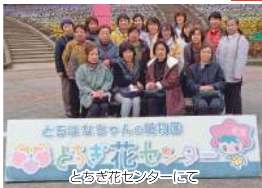
とちぎ花センターにて

春本番前ということもありは少し肌寒い日でしたが、所々にうかがえる春の様子を見て・食べて、五感で楽しむことが出来ました。