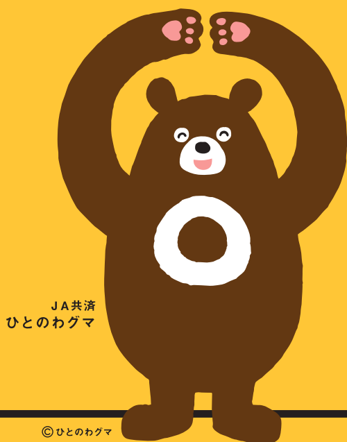
JA共済 ひとのわぐま

お客様の大切な現金等重要物をお預かりする際は、 受取書・領収書 等を 必ずお渡ししております。