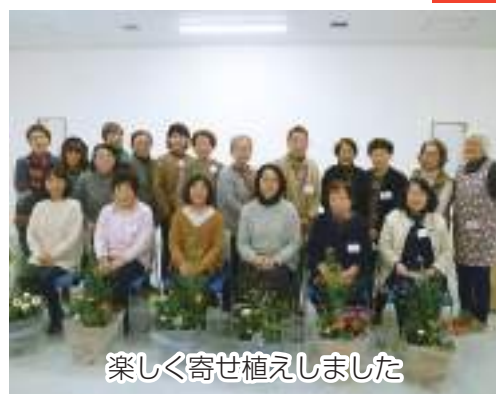
楽しく寄せ植えしました