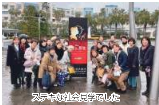
ステキな社会見学でした

JA ちば東葛西船地区女性部は2月21日、春の社会見学でミュージカルを鑑賞しました。